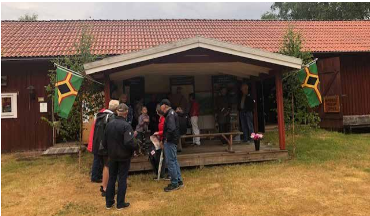
Folket välkomandes av två skogsfinska flaggor vid bygdegården.