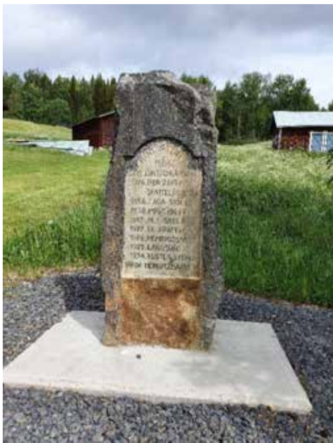
Minnessten i Ringvattnet