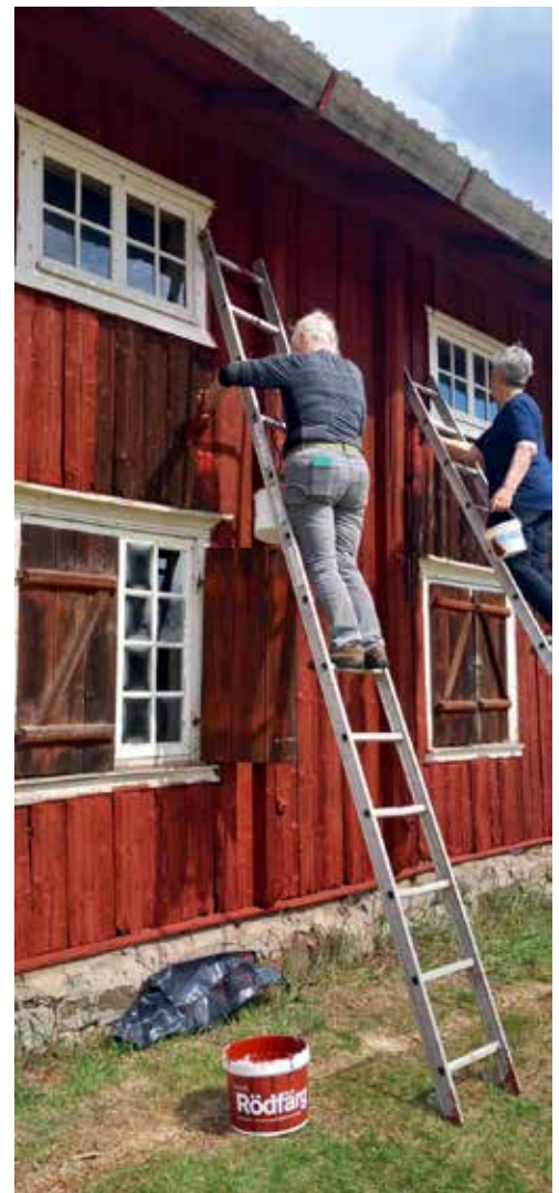
Prala fejas inför säsongen.

10/9 Tyskeberget finnetorp, Kulturminnedag