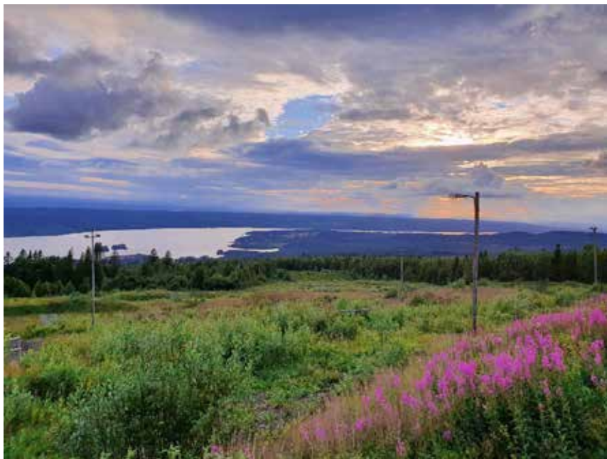
Utsikt från Tåsjöberget