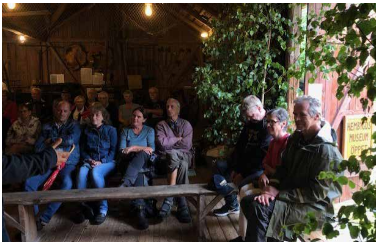
Intresserade åhörare på firandet av skogsfinska dagen.