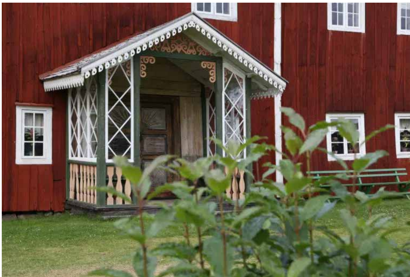
Fågelsjö Gammelgård har en fin ingång omgiven av snickarglädje.

18-20/8 Höstkonferens i Strömsund, www.finnsam.org